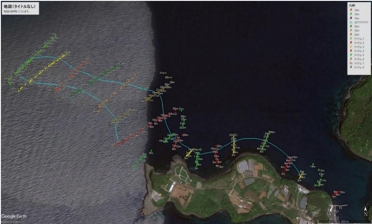
※水色線＝水深20mライン