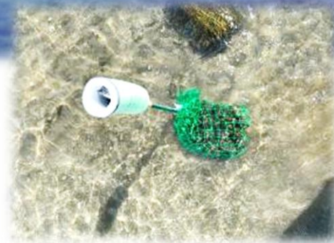
水質浄化セラミック設置