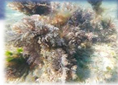
水質浄化セラミック上に 繁茂する藻