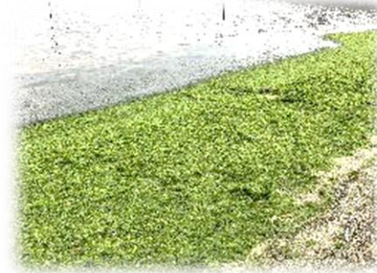
取り組み前の大村湾 アオサの異常繁殖など環境悪化