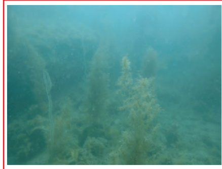
③: 疎生 (被度 25%~50%)