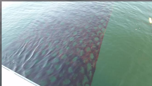
養殖網で生育する海苔