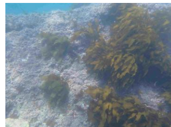
海藻類が再生した海