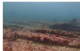
海藻類が消失した海