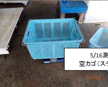
5/16測定 空カゴ(ステン有)