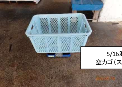
5/16測定 空カゴ(ステン無)