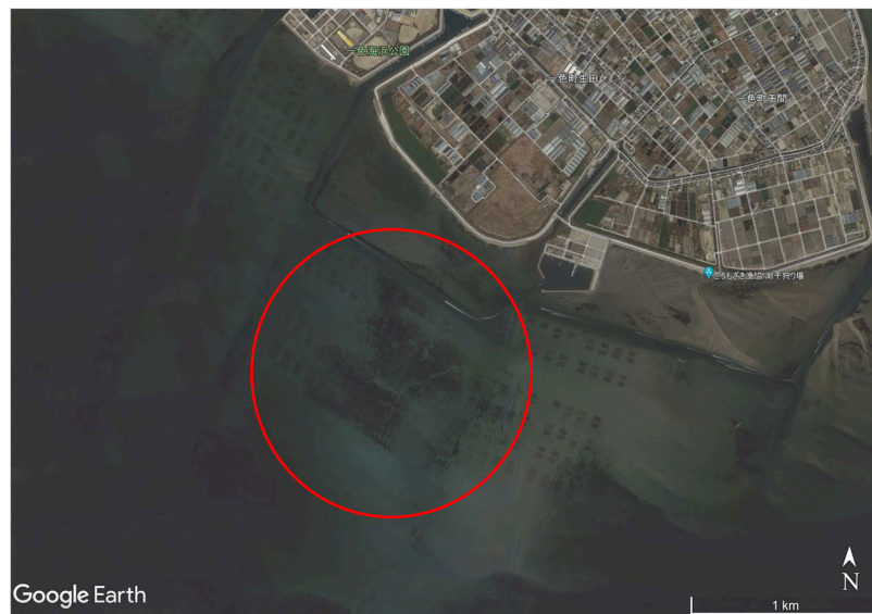
2014年3月17日 一色町地先 航空写真