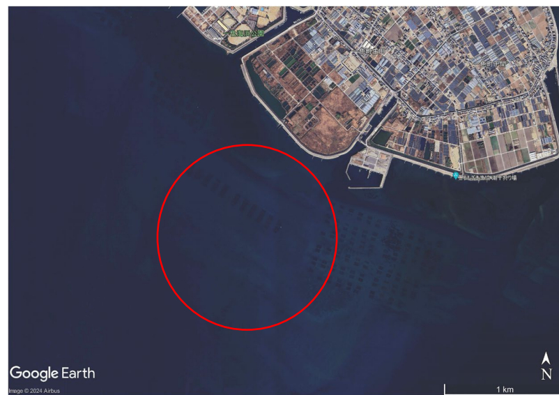
2024年1月14日 一色町地先 航空写真（GoogleEarthより）