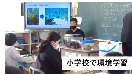
小学校で環境学習