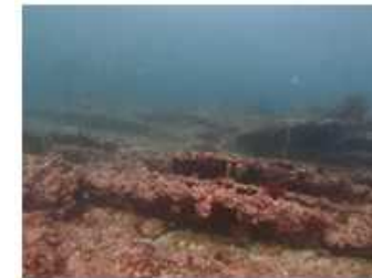
海藻類が消失した海

平成18年から令和4年の間に 岩礁性藻場は 98.5%減 、アマモ場は 95%減 となった (横須賀西部水産振興事業団調査より)