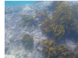
海藻類が再生した海