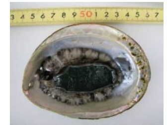
身の小さい海産物