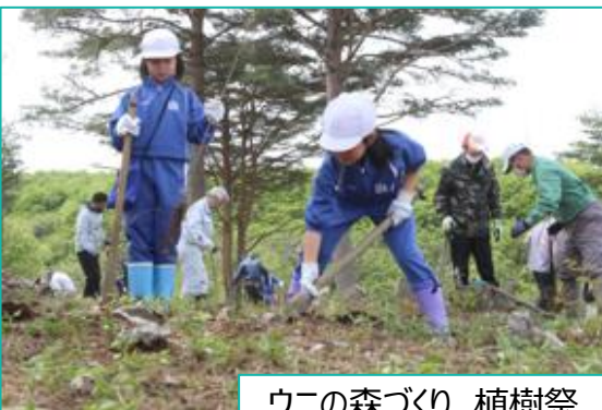
ウニの森づくり 植樹祭