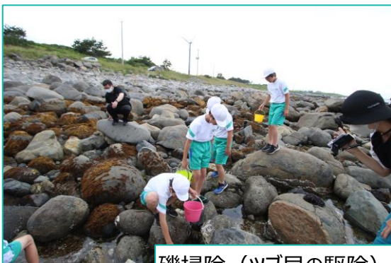
磯掃除（ツブ貝の駆除）