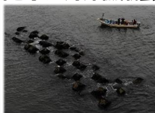
人工リーフ周辺でのウニ魚の様子