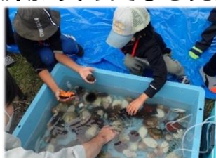
環境教育活動(夏の海塾)