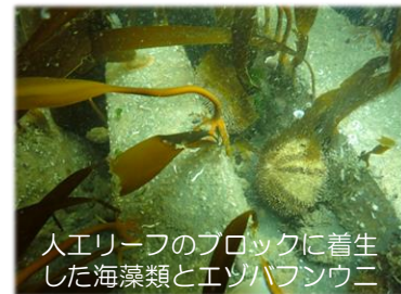
人工リーフのブロックに着生した海藻類とエゾバフンウニ

人工リーフは水産協調型の構造が採用され、ミツイシコンブ等の海藻類の着生のほか、ウニ類・マナマコ等の生息場所となるなど多様性に富んだ生態系が確認されています。