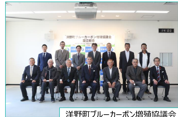
洋野町ブルーカーボン増殖協議会