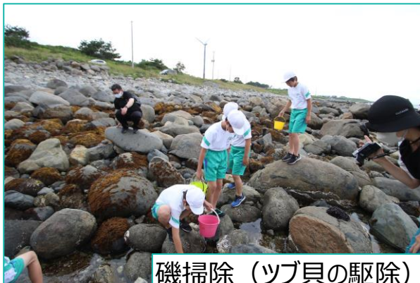
磯掃除（ツブ貝の駆除）

増殖溝178本の総距離は17.5km、幅は約4m、深さは約1mにわたり、干潮時でも波力により新鮮な海水が流れ込む構造にすることで、ワカメや昆布などの大型の海藻が乾燥に耐え、生育しやすい環境を創り出しています。増殖溝やその周辺で育った海藻は、潮の干満により流れ藻として海に流出し、CO 2 を海底に固定することに貢献してきました。また、増殖溝によって、身入りの良い高品質なキタムラサキウニが豊富に採れるようになり、ウニ漁と藻場の保全、即ち気候変動対策を両立させる持続可能な漁業が受け継がれてきました。今回のクレジット販売により得られた資金は、洋野町ブルーカーボン増殖協議会が中心となり、気候変動対策の更なる発展のために活用していきます。