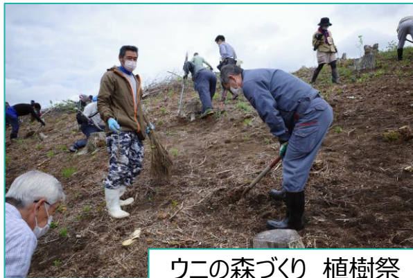
ウニの森づくり 植樹祭